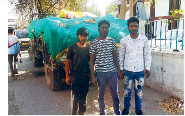
भिवानी। अनाजमंडी में कचरे से भरी खड़ी ट्राली और सफाई नहीं होने से अनाजमंडी में पड़ा कचरा।

हरिभूमि न्यूज ▶ मिवानी अनाजमंडी व उसके रिहायशी क्षेत्र से निकलने वाले कचरे को डालने को लेकर ठेकेदारों में ठग गई है। दादरी रोड स्थित डमिंग प्लांट पर अनाजमंडी का कचरा नहीं डालने देने की वजह से पिछले चार दिनों से एक ट्रैक्टर ट्राली कचरे से भरी मंडी में खड़ी है। कचरा न डालने की वजह से मंडी की सफाई व रोजाना निकलने वाला कचरे के भी जगह जगह ढेर लगे हैं। गिला व सूखा कचरा होने की वजह से अनाजमंडी में बदबू आने लगी है। हालात ये बने हैं कि वहां रहने वाले लोग नारकीय जीवन जीने पर मजबूर हो रहे हैं। यह स्थिति तब बनी है। जब इसी माह में सरसों की फसल तथा अप्रैल के पहले सप्ताह में गेहूं की फसल पहुंच जाएगी। फिलहाल अनाजमंडी की सफाई व्यवस्था पटरी से उतरी हुई है। इस बारे में अनाजमंडी के व्यापारी जिला प्रशासन से मिलने का मन बना रहे हैं। चूंकि सफाई न होने से लोगों का जीना मुहाल हो चुका है। यहां यह बताते चले कि अभी तक दादरी रोड स्थित डमिंग प्लांट पर कचरा