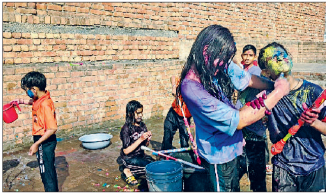
मिवानी। फाग खेलते बच्चे।