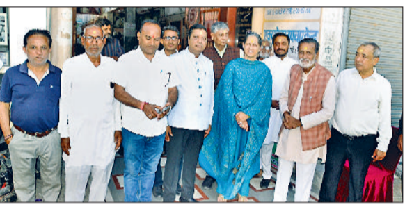
मिवानी। होली मिलन कार्यक्रम में उपस्थित लोग।