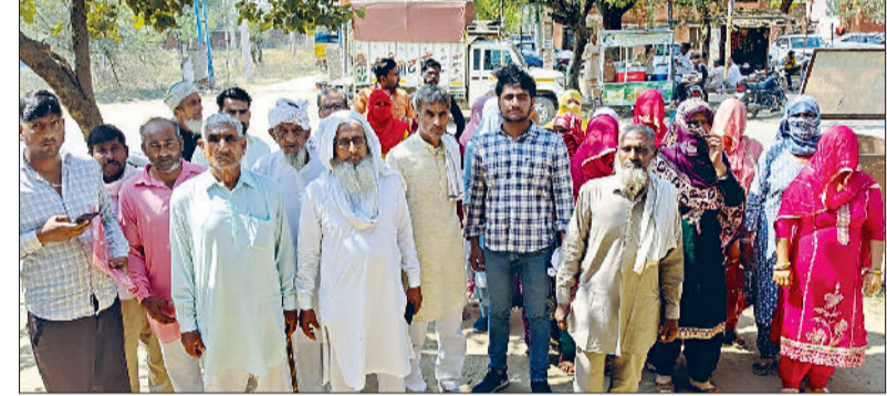
बाढ़ड़ा। उपायुक्त को ज्ञापन देने के बाद बीडीपीओ कार्यालय पहुंचे श्यामकला के ग्रामीण।