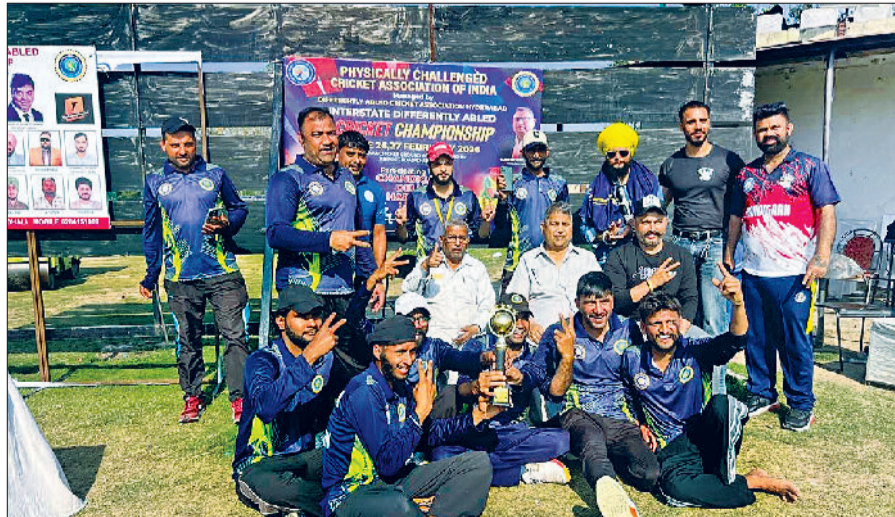
मिवाणी। विजेता टीम के साथ पीसीसीएआई के सदस्य।