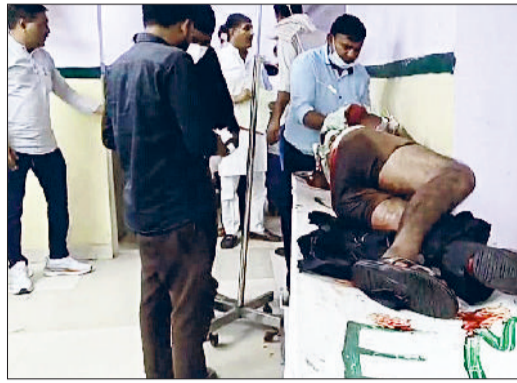
मिवानी। सामान्य अस्पताल में उपचाराधीन का इलाज करते चिकित्सक।